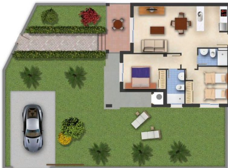
Imagen Artística carece de valor contractual/Artistic Image free of contractual nature

Model: Alba Garden Property: 76,7m 2 Garden: 224 m 2 2 Bedrooms 2 Bathrooms